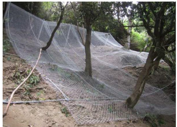
【トロッコ保津峡・トロッコ亀岡駅間】