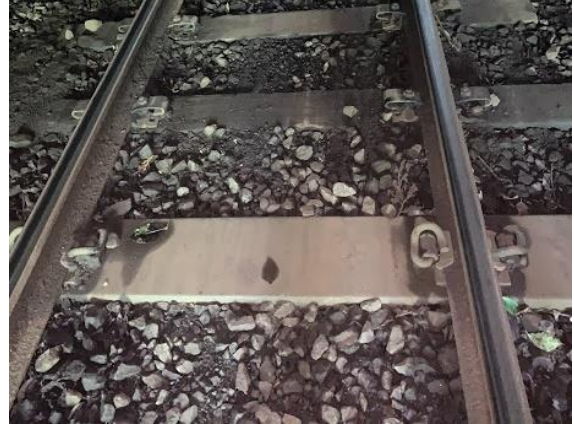
【トロッコ保津峡・トロッコ亀岡駅間】